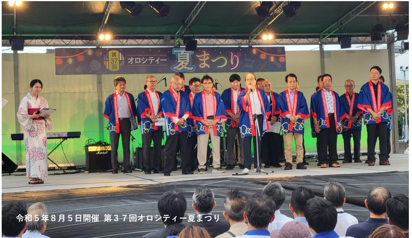
令和5年8月5日開催 第37回オロシティー夏まつり