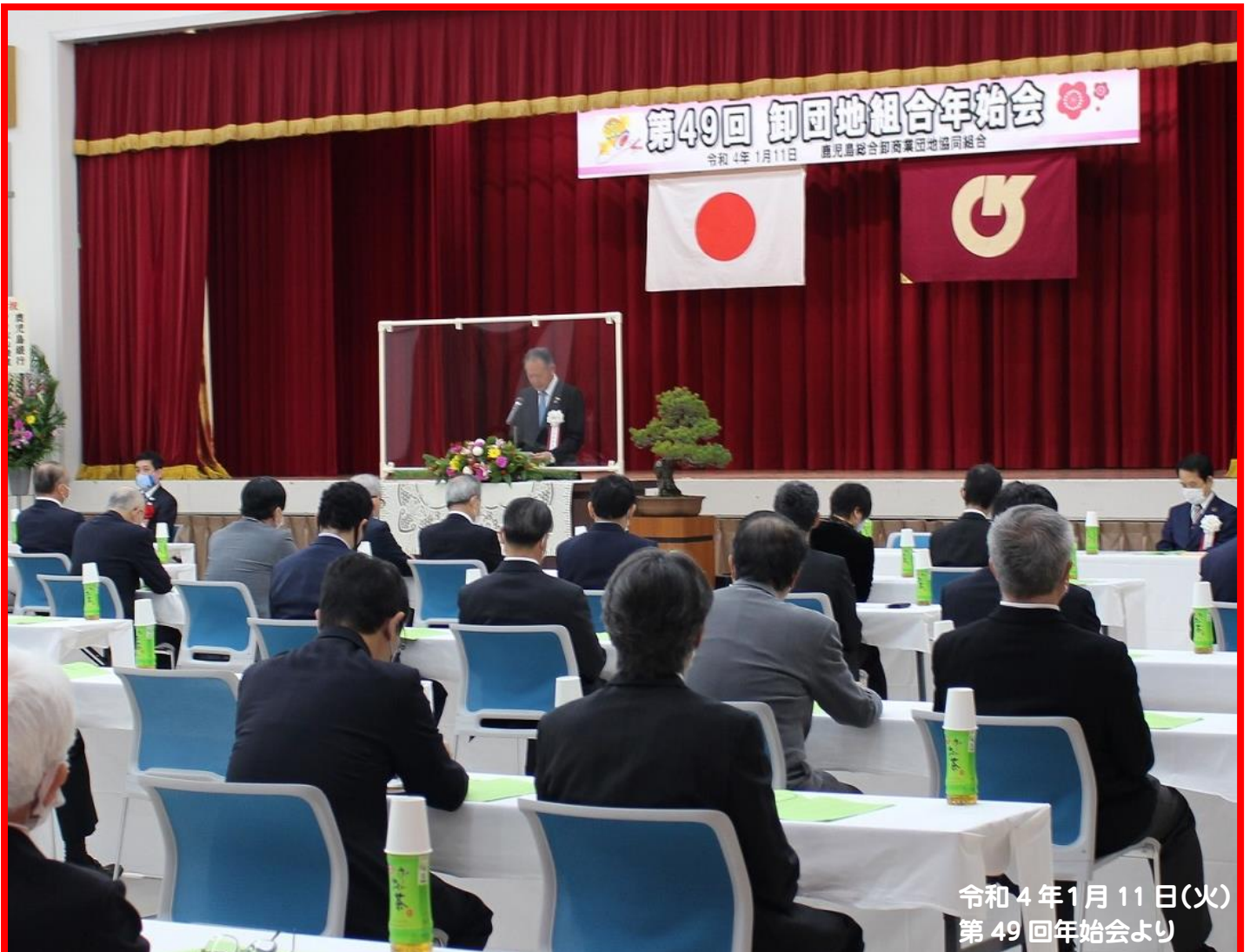
令和4年1月11日(火) 第49回年始会より