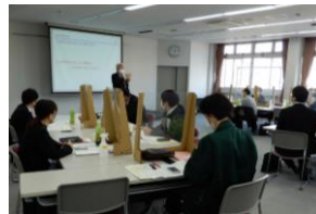
＜オロシティーホール2階大会議室にて＞

望まれる行動などチーム運営の基本を学んでいただくとともに、コミュニケーションスキルや問題解決能力などリーダーとして求められる基礎力の向上を目的としています。受講者は3社から26名、研修は毎回10時～17時で行われ、計4日間開催されます。1月17日に第1回目が開催され、丸一日という長丁場ですが、受講者はグループワーク等、積極的に発言し真剣に取り組んでいました。