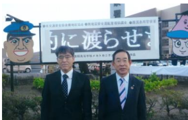
＜設置された電光掲示板の前にて＞

12月8日鹿児島南警察署にて鹿児島情報高等学校メカトロニクス科の学生が作成した電光掲示板の点灯式が執り行われました。今回の式は年末年始の交通事故防止運動のパトロール隊の出発式も兼ねており、白バイ隊等が参加する盛大な式となりました。式の中で鹿児島南警察署署長から同校の代表者へ感謝状が贈呈されました。この掲示板の設置により、地域の交通安全に対する意識が向上し、交通事故が減少することを期待しています。