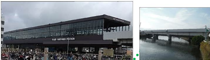
新 JR 谷山駅↓

卸団地と谷山駅・慈眼寺駅間はともに約 2 キロあるが、駅と卸団地を直接結ぶバス路線等はなく、組合員からも改善を希望する声が多く聞かれ、組合の未来戦略委員会において議論も行われている。これからの大きな課題として組合としても取り組んでいく。