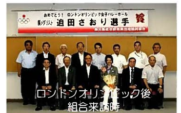
ロンドンオリンピック後 組合来訪時

今回の最終予選、日本が苦しめられたタイ戦で 24 得点をあげるなどチームを勝利に導いた迫田さおり選手は、組合員である小園硝子商会 社員の娘さんであり、地元谷山育ち。2012 年のロンドンオリンピックに続き 2 回連続出場となる。前回のロンドンオリンピックでは銅メダルに輝き、メダルを持って組合へも来訪していただいている。今回もさらなる活躍を期待するとともにケガの無いように頑張ってください。卸団地の皆様も迫田選手を応援しましょう！