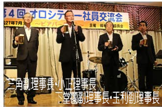
三角副理事長、下堂副理事長、玉利副理事長